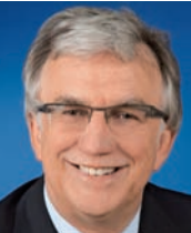
Edgar Wagner Landesbeauftragter für den Datenschutz Rheinland-Pfalz